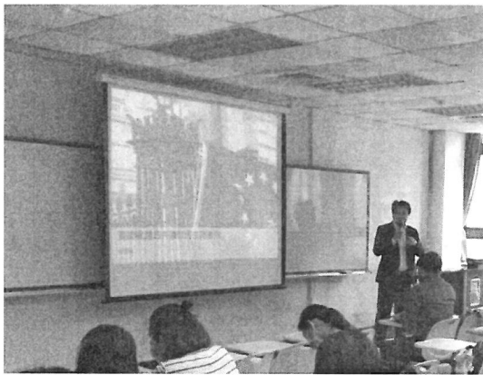
相關圖片 1 說明 演講者演講情形