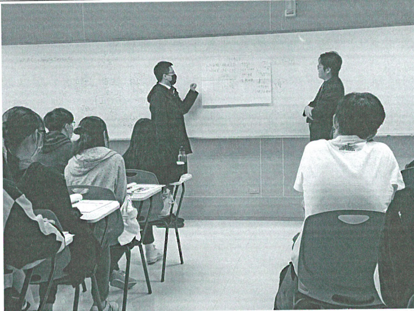
110年11月06日 工作坊實況