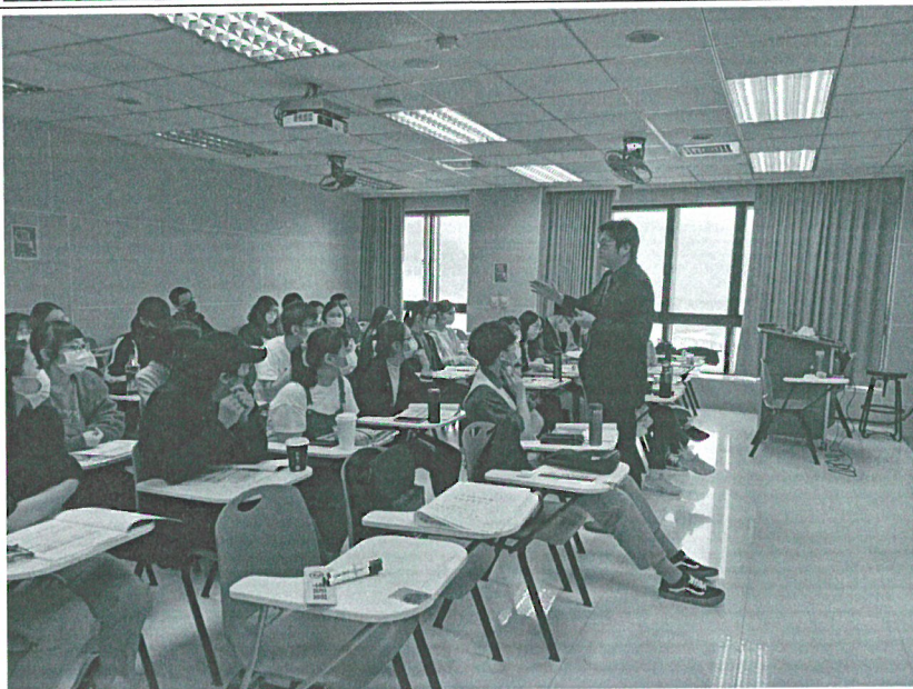
110年11月06日 工作坊實況