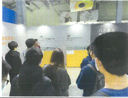
導覽人員解說齒輪箱馬達設備。