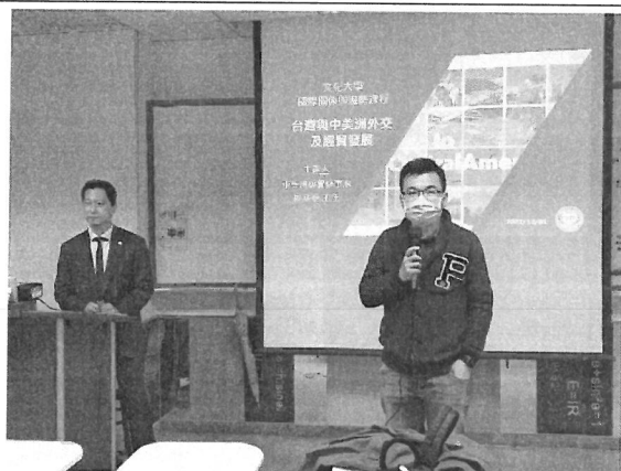
相關圖片 1 說明 老師介紹演講者