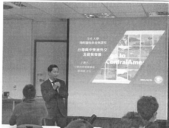
相關圖片 2 說明 演講者演講情形