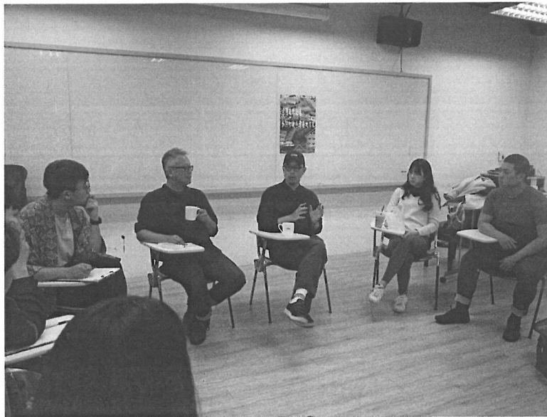
老師講解戲劇製作、營運的概念