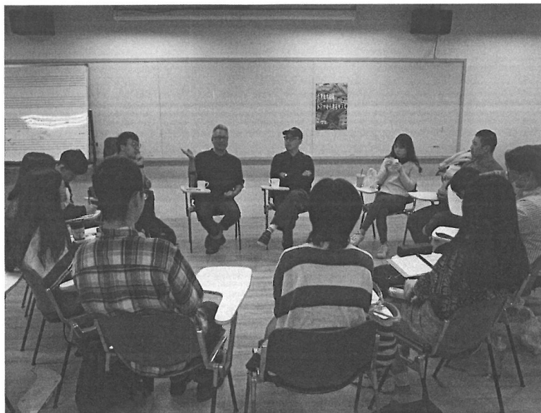
老師分析戲劇《十殿》