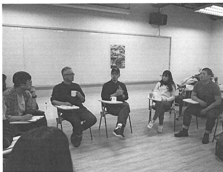
老師講述戲劇業界的現況