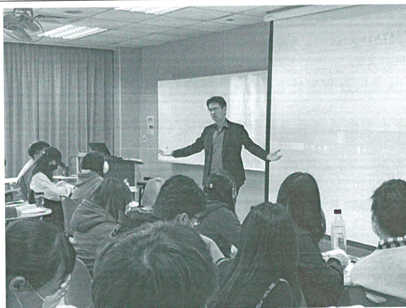
110年11月13日 工作坊實況