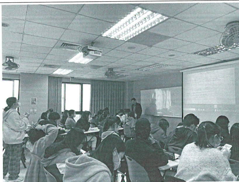
110年11月13日 工作坊實況