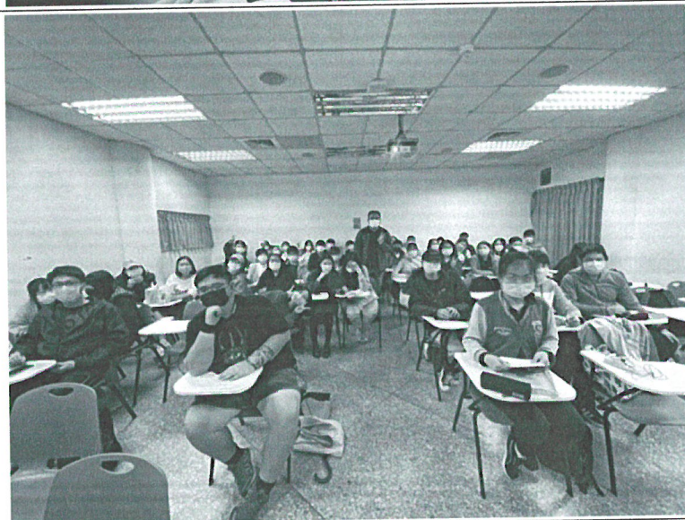
110年10月25日 講座實況- 演講後與參與學生 合影