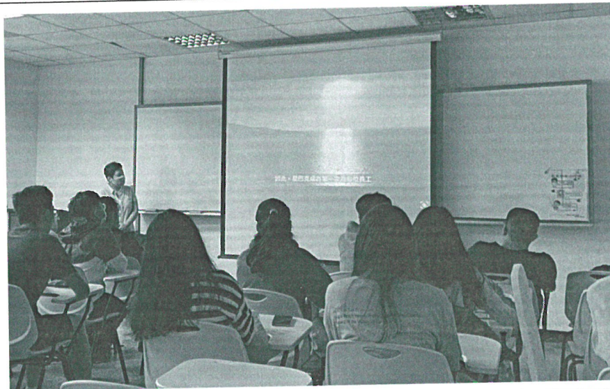
110年4月26日 講座實況- 演講後與參與 學生合影