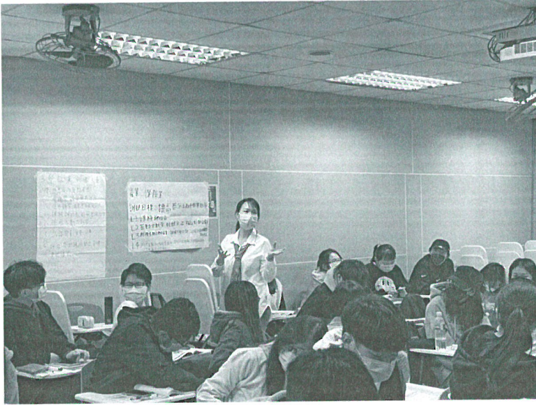
110年11月20日 工作坊實況