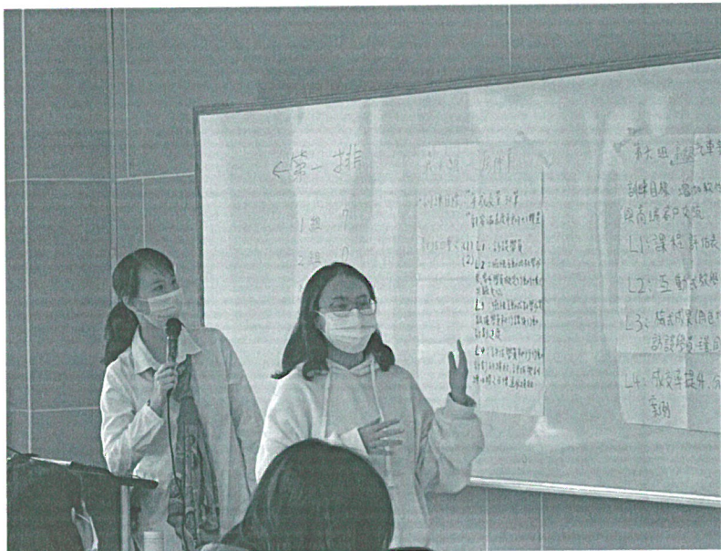
110年11月20日 工作坊實況