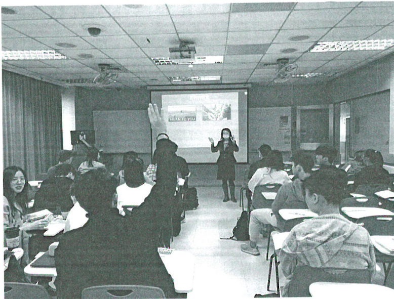
110年04月17日 工作坊實況