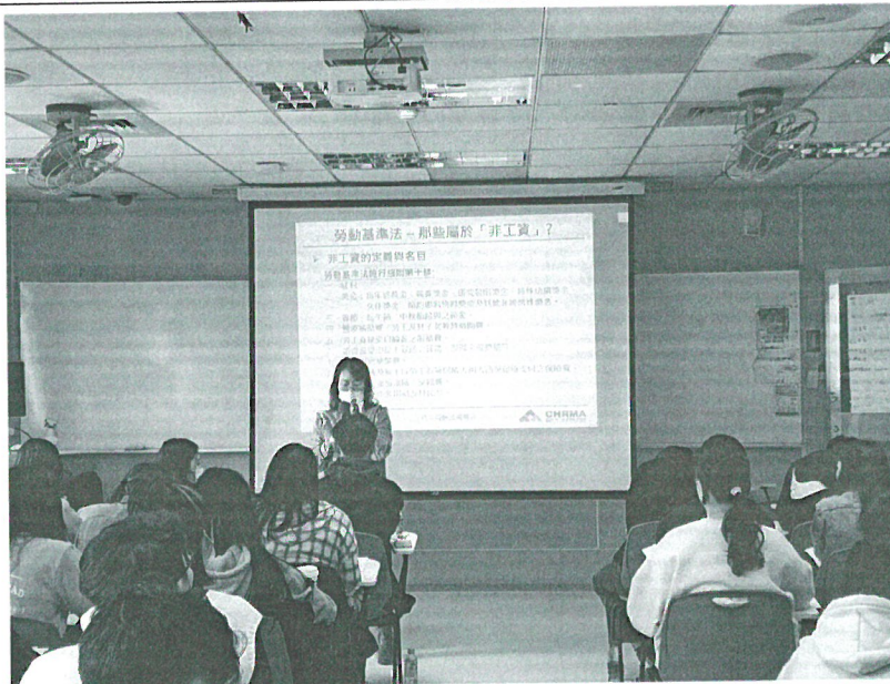
110年04月17日 工作坊實況