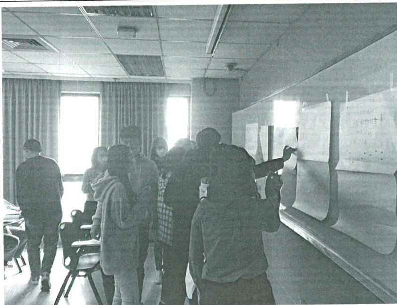
110年04月17日 工作坊實況