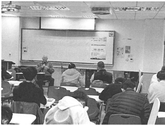
圖片 3 說明 學生聆聽演講情形