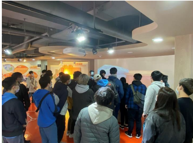
解說人員正解釋產品配置與包裝裝箱