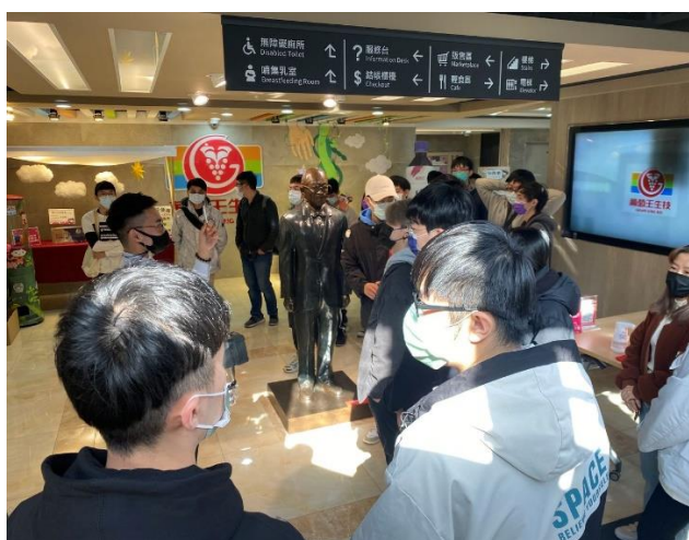
解說人員解說產品相關知識