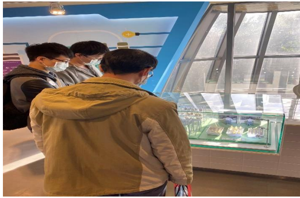
與帶隊老師一起討論工廠製程模型