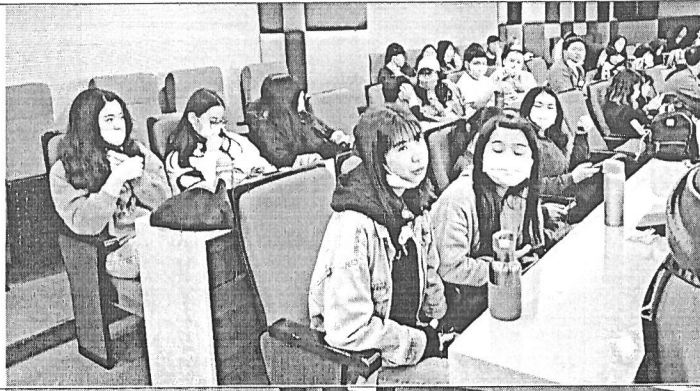
學生聽講互 動狀況