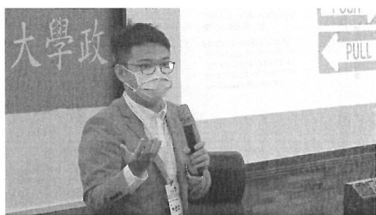
圖片 5 說明 發表人演講情形