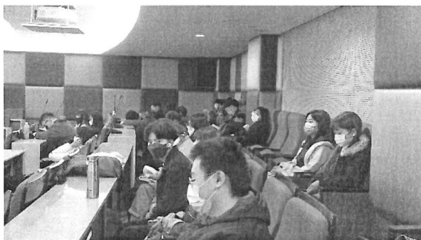
圖片 3 說明 學生聆聽演講情形