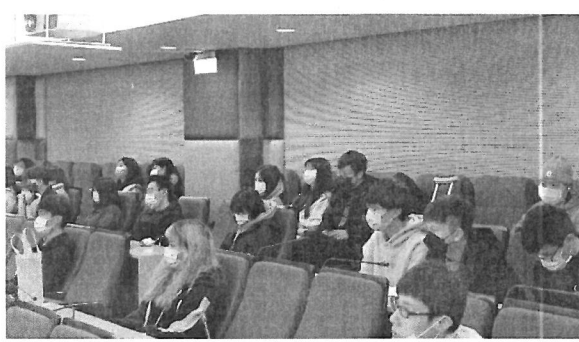
圖片 4 說明 學生聆聽演講情形