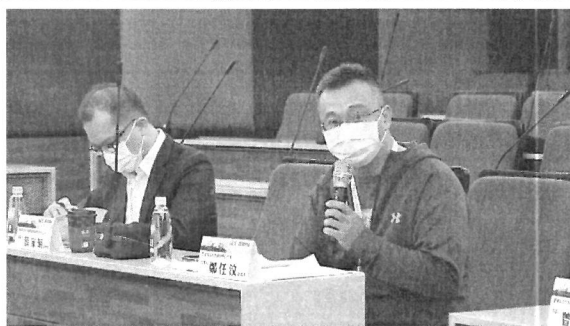
圖片 6 說明 與談人發言情形