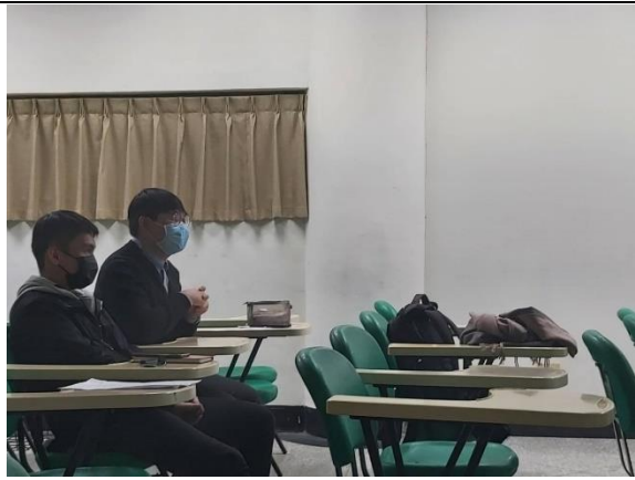
同學面對委員反饋提出想法