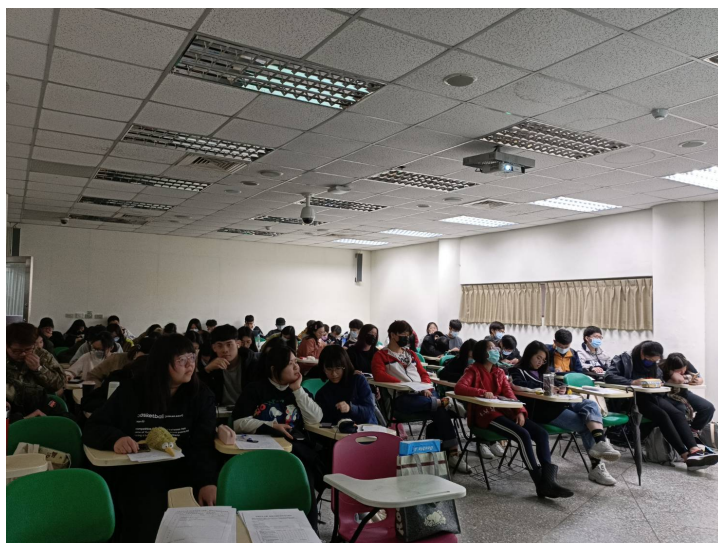
參與本次課程學生聽講情況