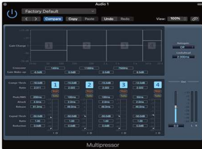
上課記錄_常用人聲處理技巧 2