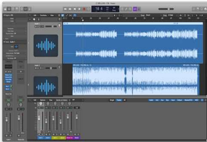
上課記錄_常用人聲處理技巧 1