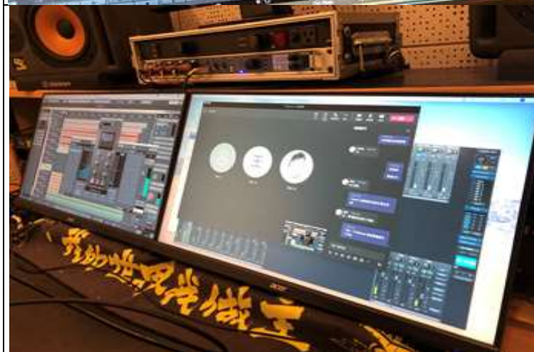
上課記錄_錄音專案混音工作流程示範 3