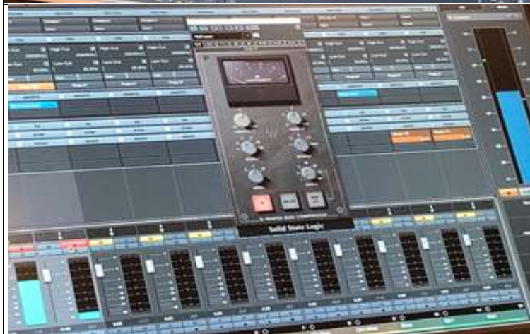
上課記錄_錄音專案混音工作流程示範 2