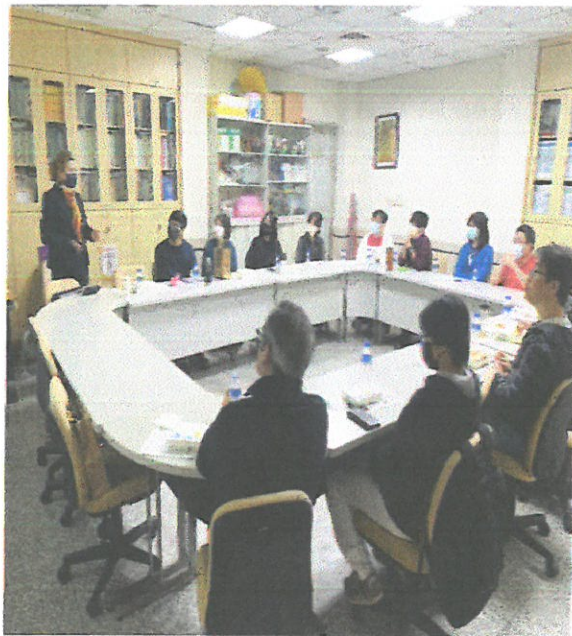
主講者分享英文授課經驗