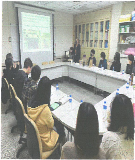
主講者分享英文授課經驗