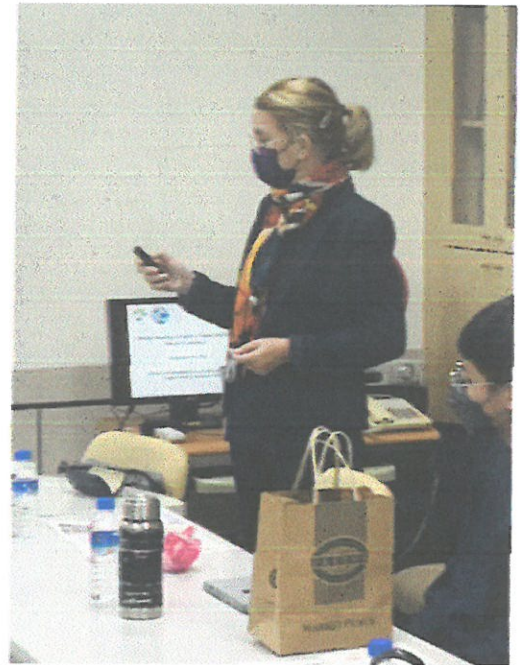
主講者分享英文授課經驗