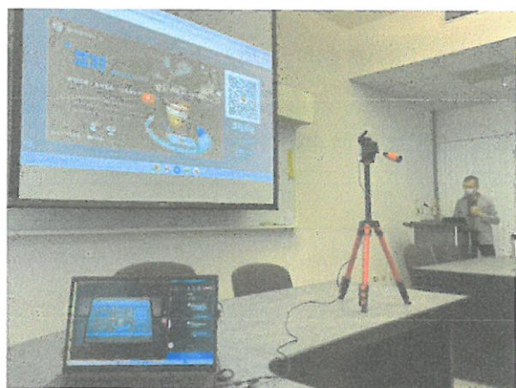
講師王錦宏介紹 Chromebook 與 Classroomscreen 搭配的技巧