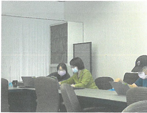
社群成員互相討論 Chromebook 操作方式