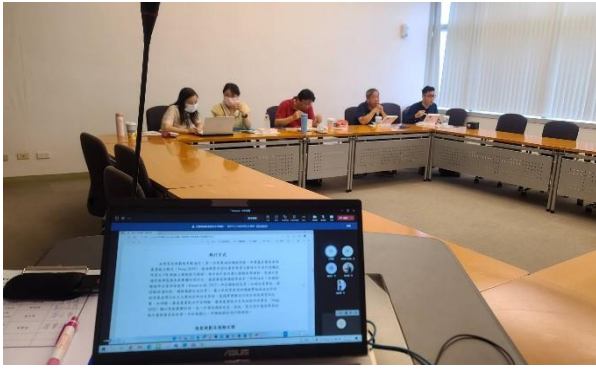
實體與線上同時進行