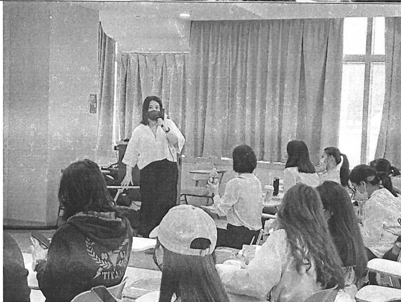
講師講解如 何控制成本