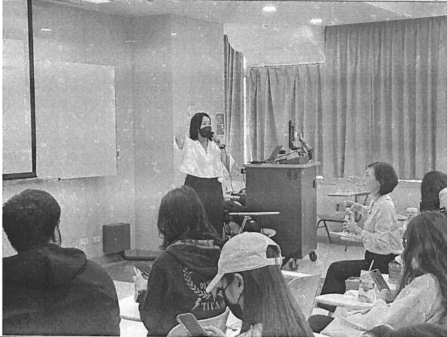
講師講解行 銷預算