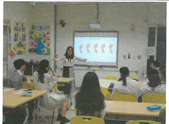
蕭老師說明提問設計的五步驟