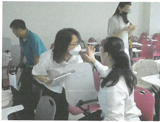
與會學生進行破冰體驗