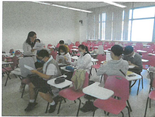
蕭老師帶領同學進行文本導讀