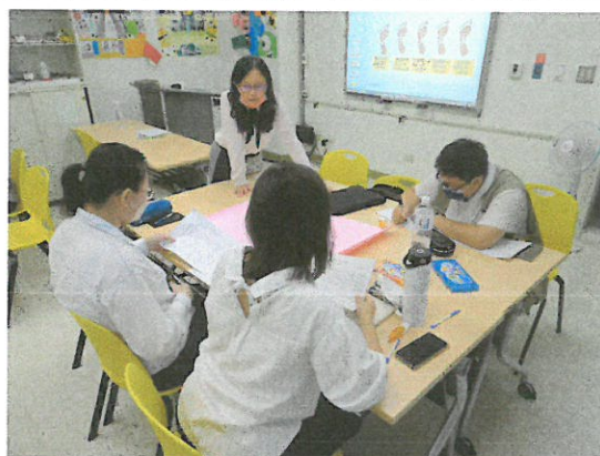
分組討論文本題目