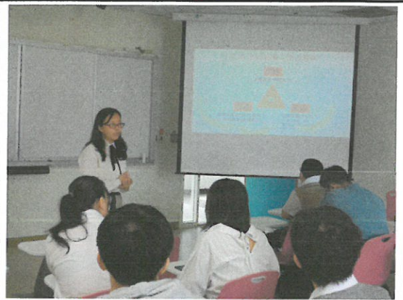
蕭老師談文本分析的架構