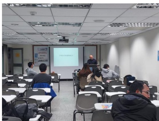
相關圖片 1 說明 老師介紹演講者情形