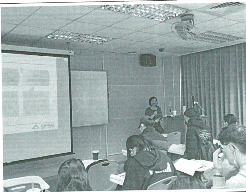
111年11月5日 工作坊實況