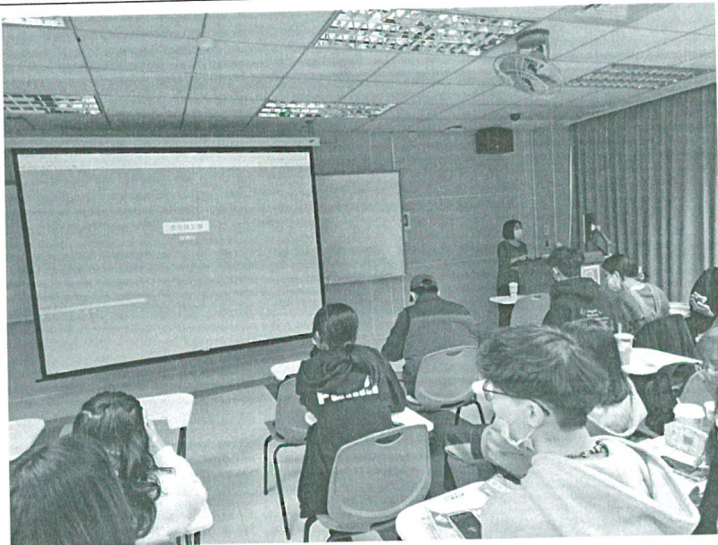
111年11月5日 工作坊實況