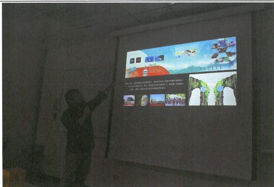
舉例國際院校會展城市行銷競賽的籌備過程