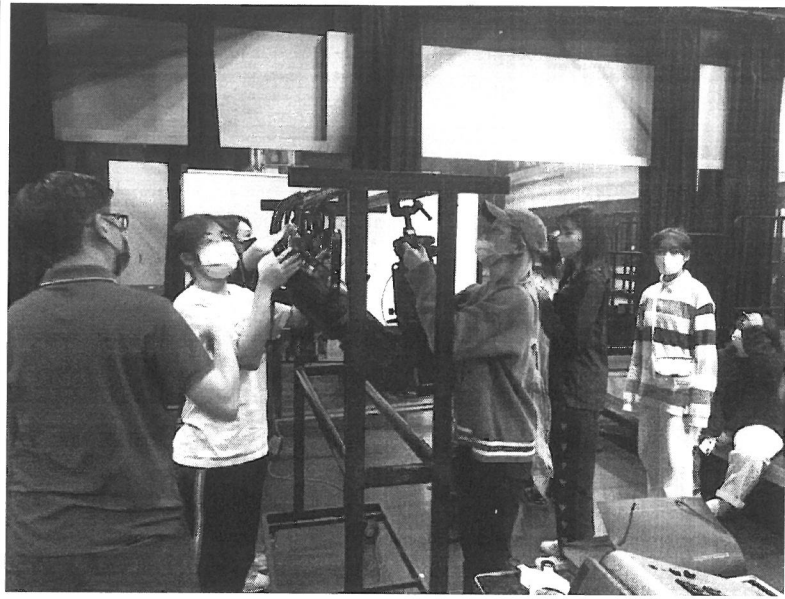
同學親自操作拆裝燈具。