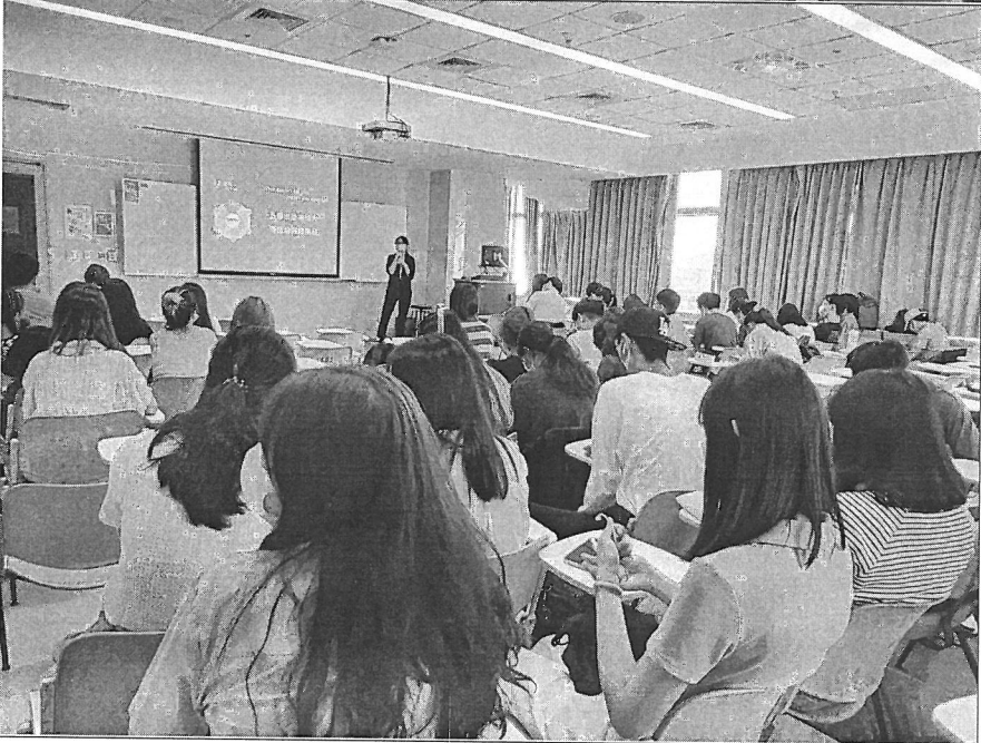
講師講解公關操作