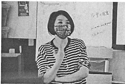
圖說：提案練習講師回饋