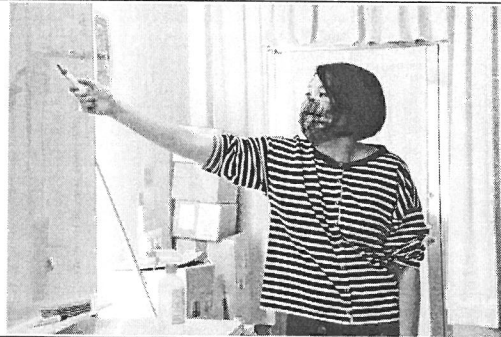
圖說：講師補充提案要點