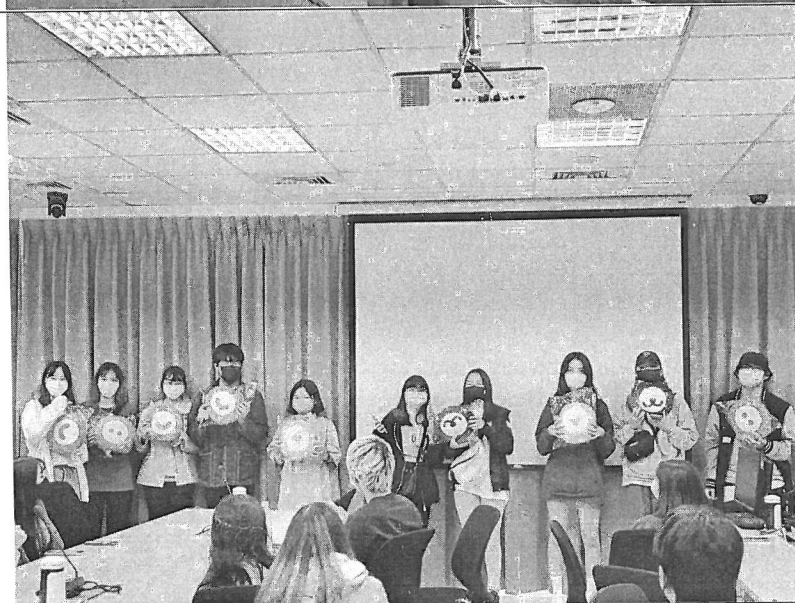
同學與 參訪 單位 互動 獲得 抱枕