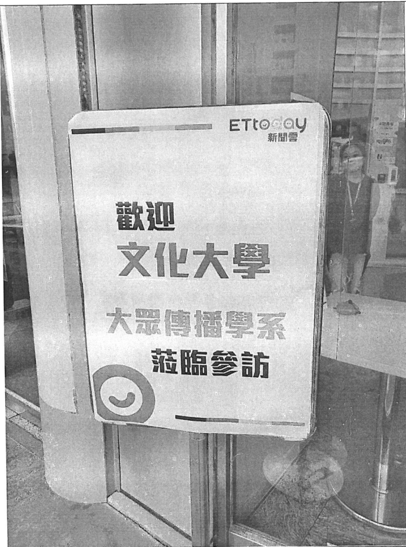
ETtoday 歡迎文 大大傳 系學生