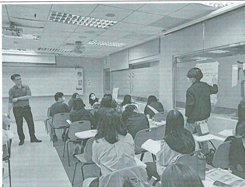
111年04月30日 工作坊實況