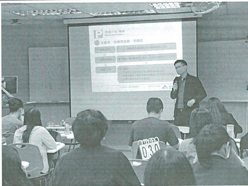
111年04月30日 工作坊實況