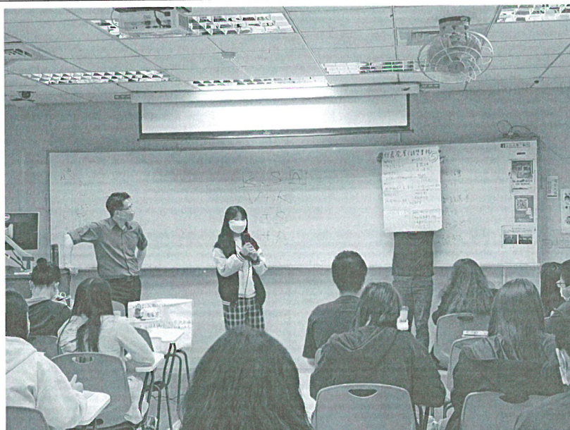
111年04月30日 工作坊實況