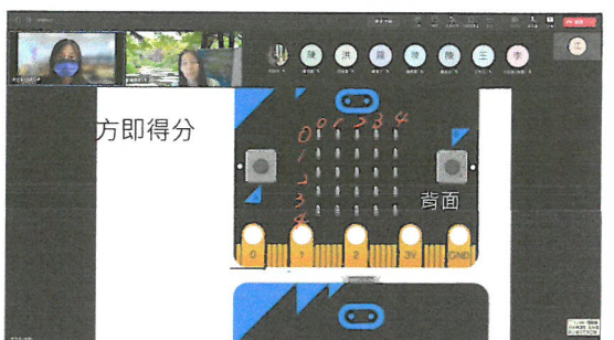
分享 ApowerMirro 如何幫助遠距教學