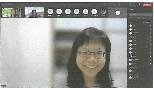
羅老師分享大學端遠距教學經驗