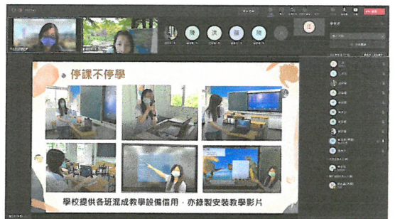
說明學校因應混成教學拍攝之教學影片