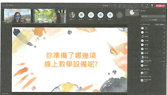
分享遠距教學需要的準備設備與功能