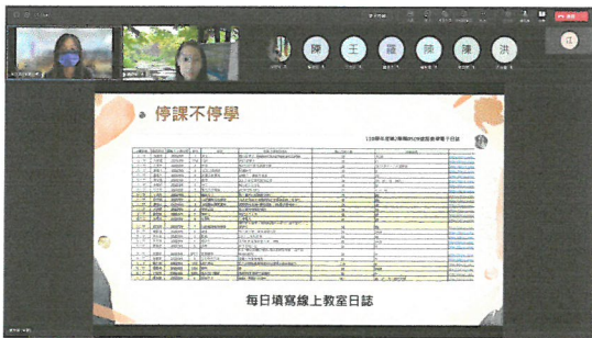
蔡組長分享掌握各班上課情形之措施