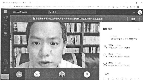
圖說：講者講述課程