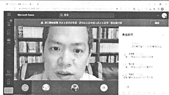
圖說：講者講述課程