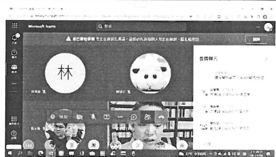
圖說：講者回應提問