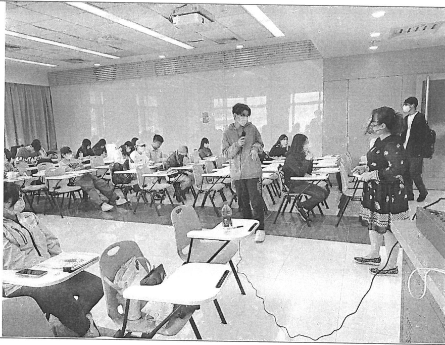
演講現場狀 況 2