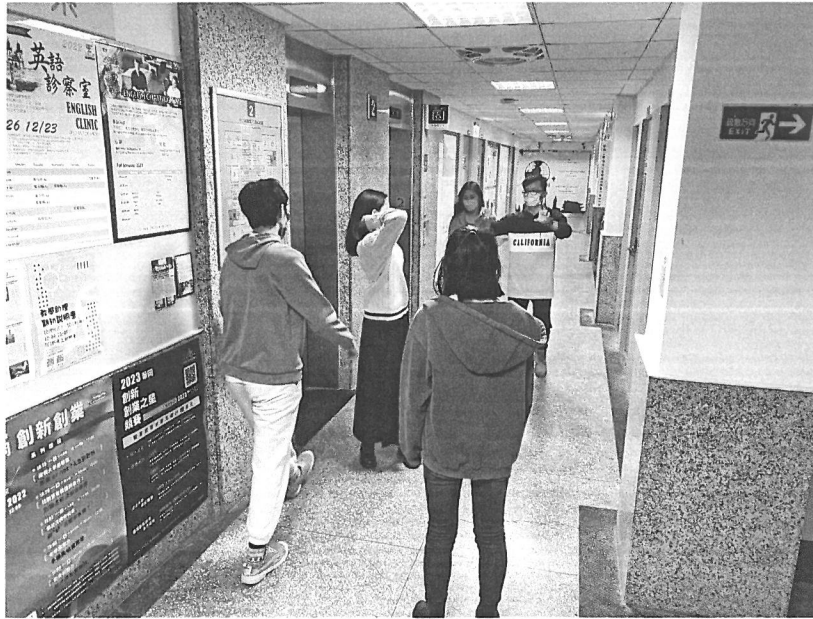
鏡頭走位編排指導