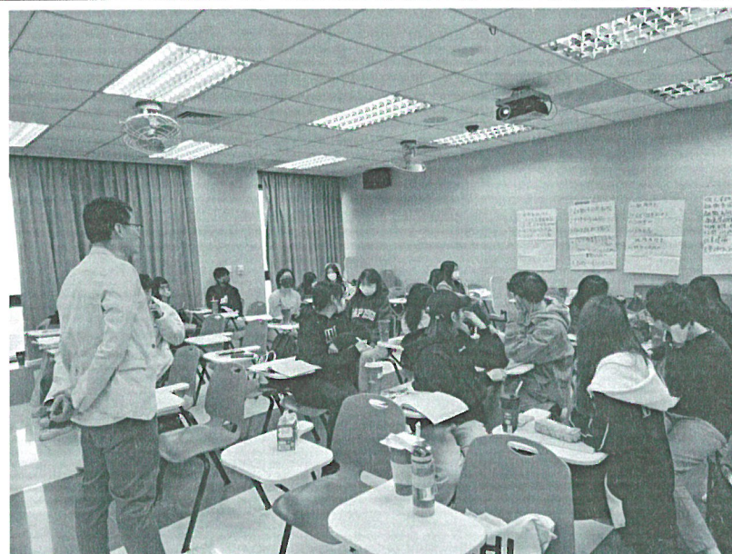
111年12月3日 工作坊實況