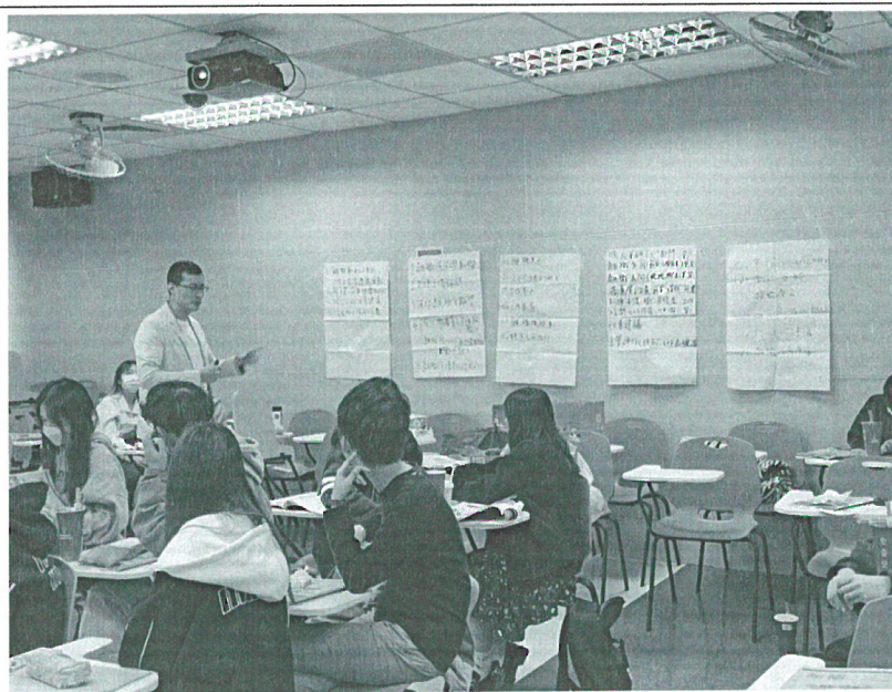
111年12月3日 工作坊實況