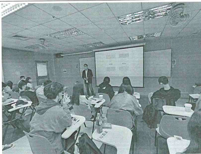
111年10月22日 工作坊實況