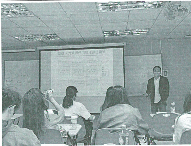
111年10月22日 工作坊實況