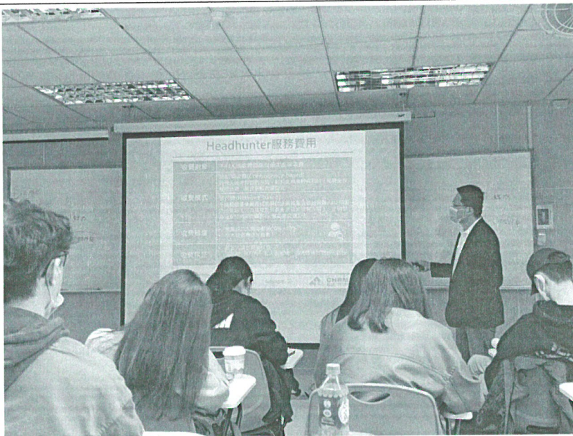
111年10月22日 工作坊實況