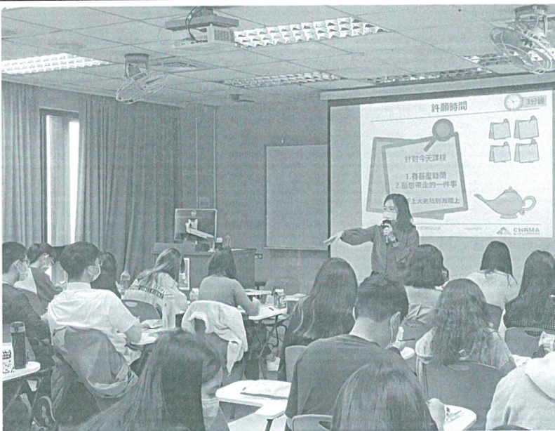
111年03月26日 工作坊實況