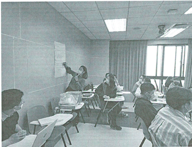
111年03月26日 工作坊實況