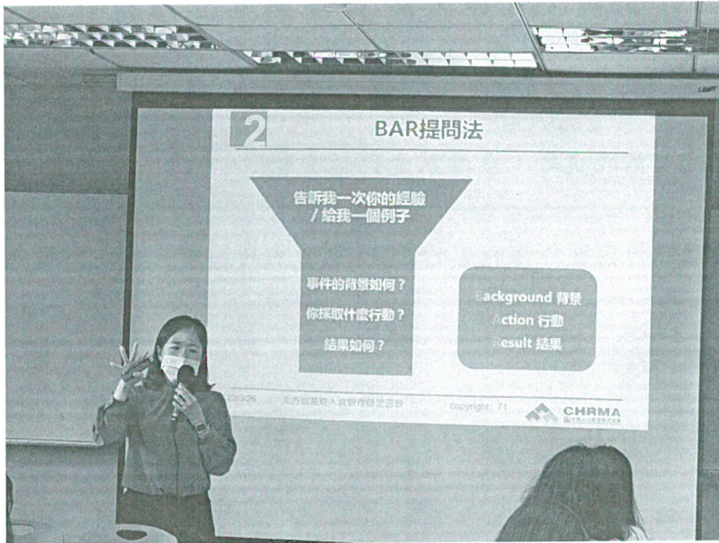
111年03月26日 工作坊實況