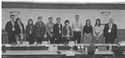
圖片 7 說明 場次一大合照