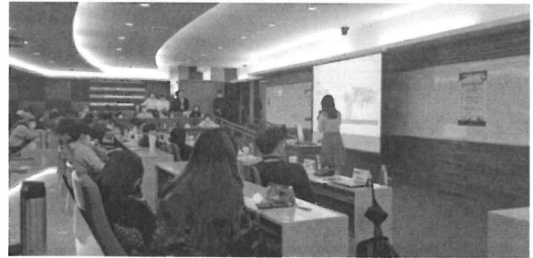
圖片 4 說明 學生聆聽演講情形