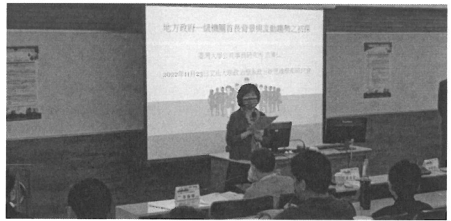
相關圖片 2 說明 蘇彩足教授致詞情形