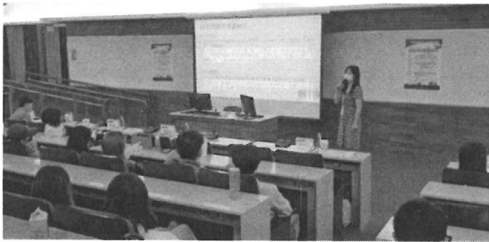
圖片 5 說明 發表人演講情形