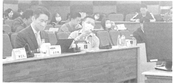
圖片 6 說明 與談人發言情形