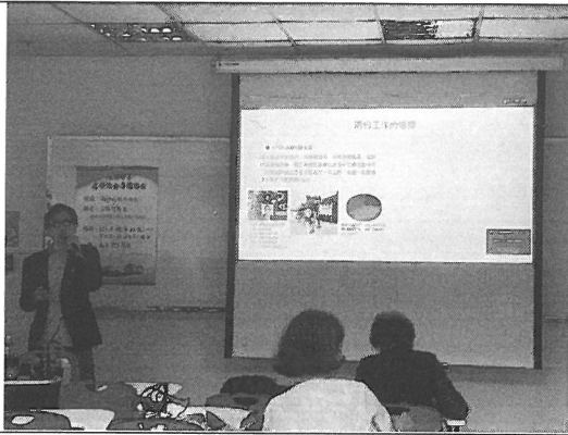
照片說明：講者演講情形。