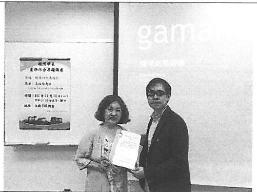
照片說明：頒發感謝狀。