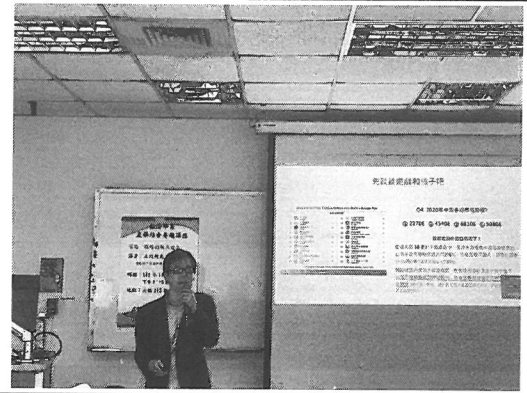
照片說明：講者演講情形。