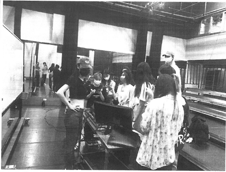
同學輪流操作控制台。