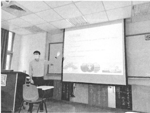
相關圖片 1 說明 演講者演講情形