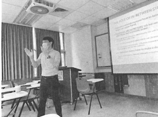
相關圖片 2 說明 演講者演講情形