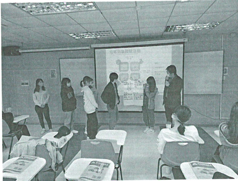
111年10月29日 工作坊實況