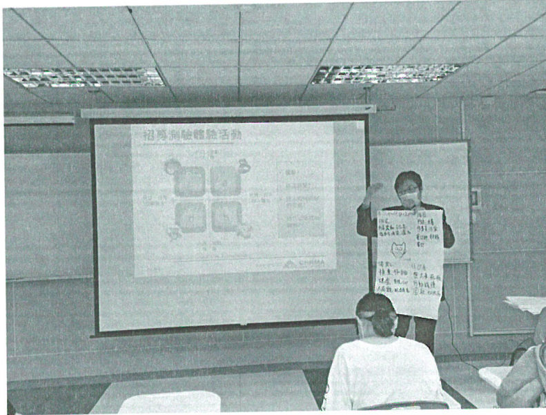
111年10月29日 工作坊實況