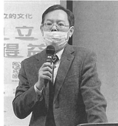
相關圖片 2 說明 演講者演講情形