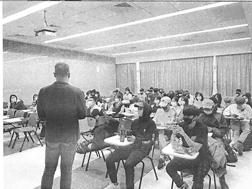
學生 認真 聽取 講師 的經 歷