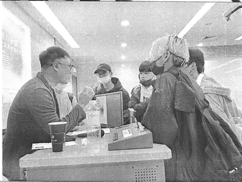
演講 後學 生與 老師 的問 答