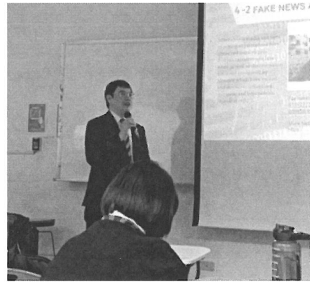
相關圖片 2 說明 演講者演講情形