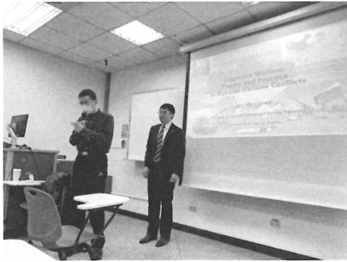
相關圖片 1 說明 主持人介紹演講者情形