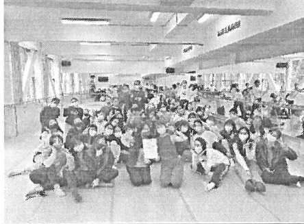
大家與老師的大合照，邀請主任頒發感謝狀給予老師，感謝老師蒞臨指導教學，也讓同學們有收穫滿滿的兩堂課。