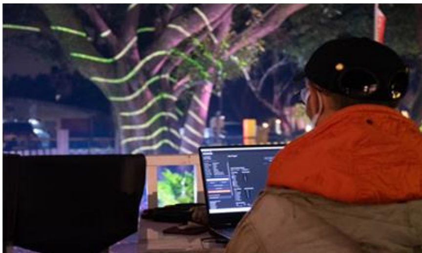
光雕藝術主 作品展演區 域-2。