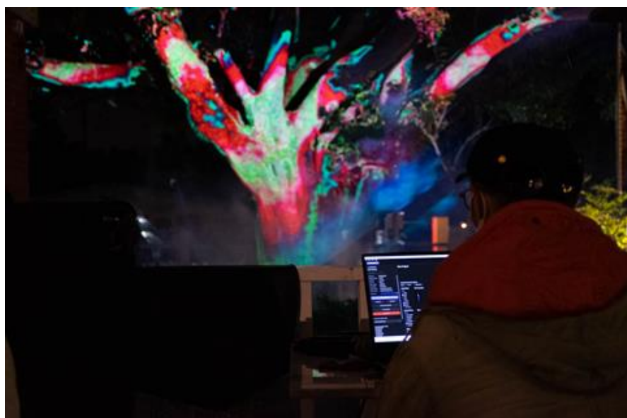
光雕藝術主 作品展演區 域-3。