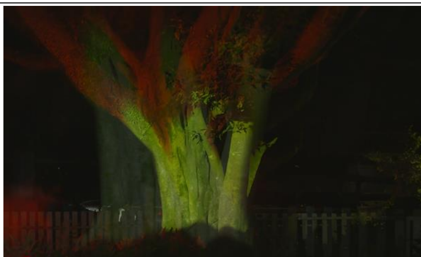
光雕藝術主 作品展演區 域-4。