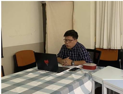
講者與線上老師討論