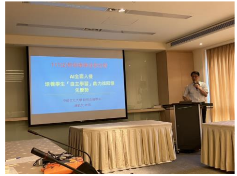
社群成立宗旨說明