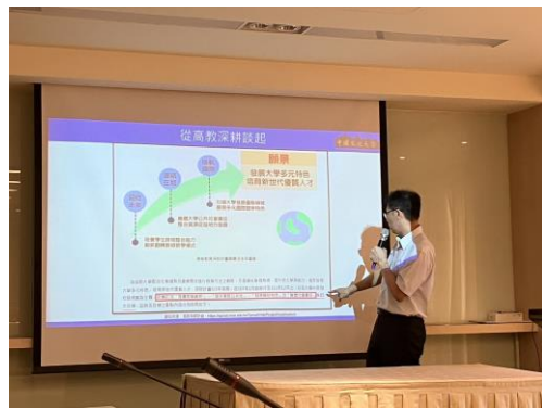
高教深耕內對自主學習說明