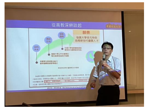
高教深耕內對自主學習說明